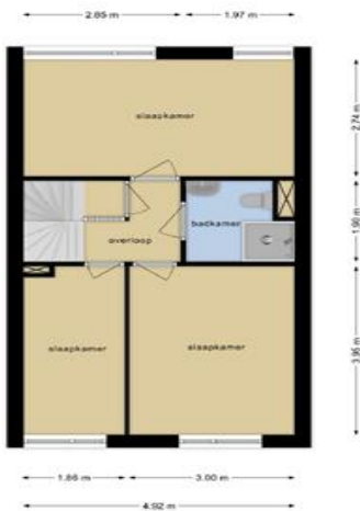
Deze plattegronden zijn opgemaakt voor indicatieve doeleinden. Hieraan kunnen geen rechten worden ontleend.