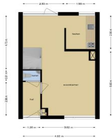
Deze plattegronden zijn opgemaakt voor indicatieve doeleinden. Hieraan kunnen geen rechten worden ontleend.