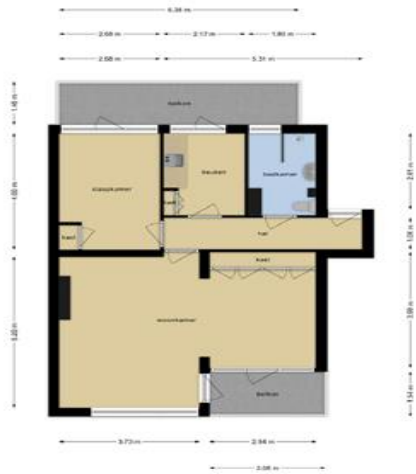
Deze plattegronden zijn opgemaakt voor indicatieve doeleinden. Hieraan kunnen geen rechten worden ontleend.