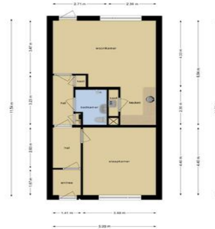
Deze plattegronden zijn opgemaakt voor indicatieve doeleinden. Hieraan kunnen geen rechten worden ontleend.