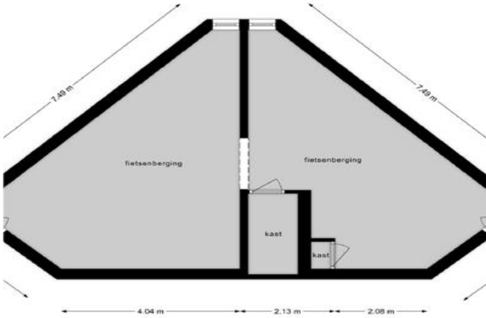
Deze plattegronden zijn opgemaakt voor indicatieve doeleinden. Hieraan kunnen geen rechten worden ontleend.