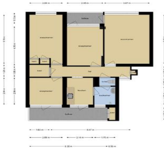
Deze plattegronden zijn opgemaakt voor indicatieve doeleinden. Hieraan kunnen geen rechten worden ontleend.