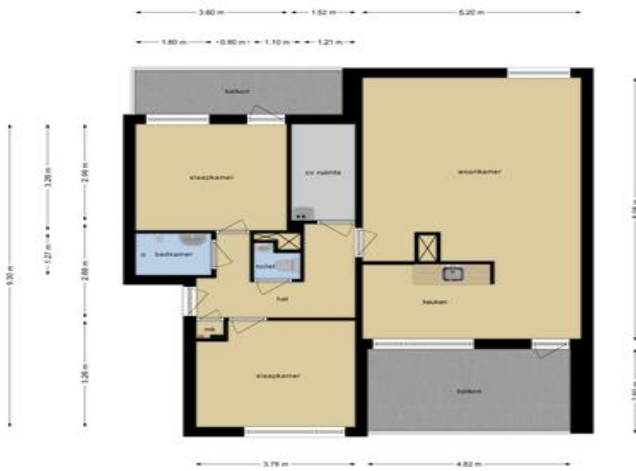
Deze plattegronden zijn opgemaakt voor indicatieve doeleinden. Hieraan kunnen geen rechten worden ontleend.